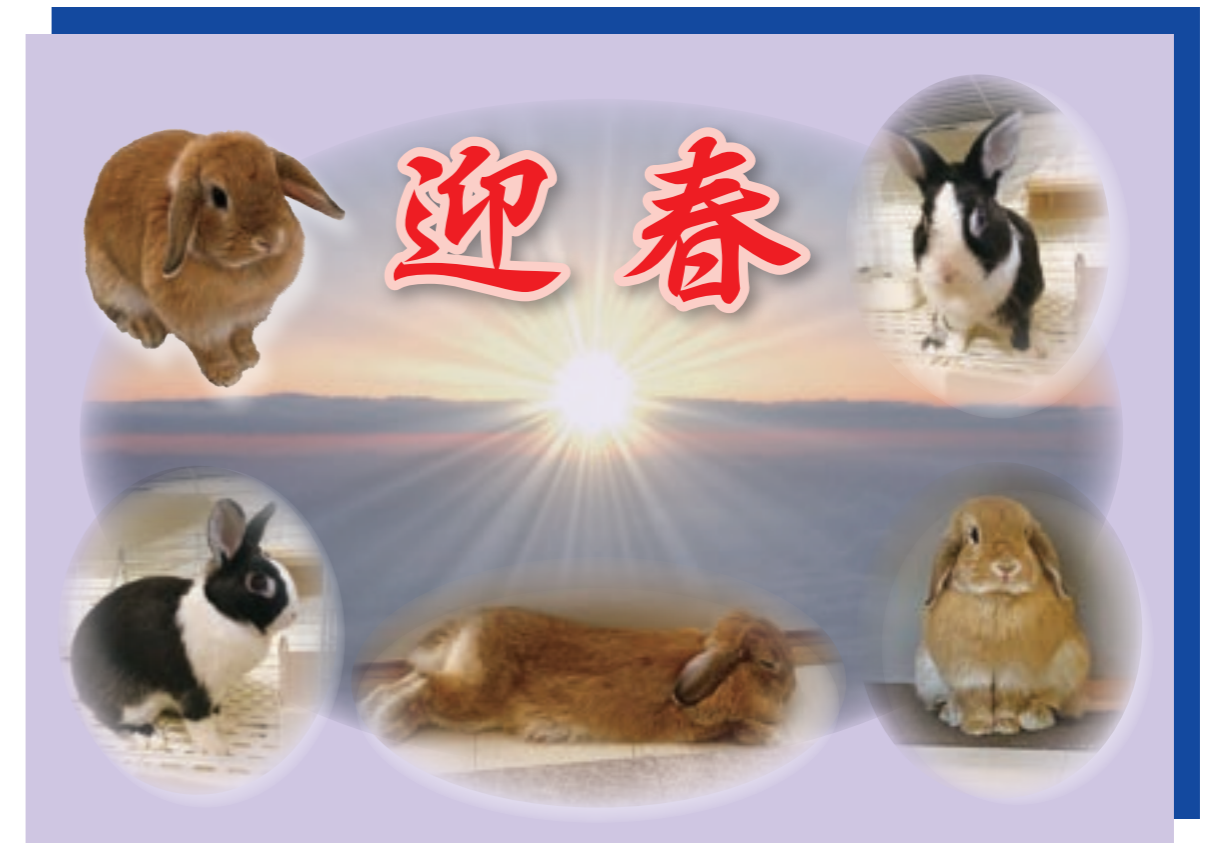
【児玉 福(一歳の女の子) 渡邊 イーヴィ(四歳の男の子)】