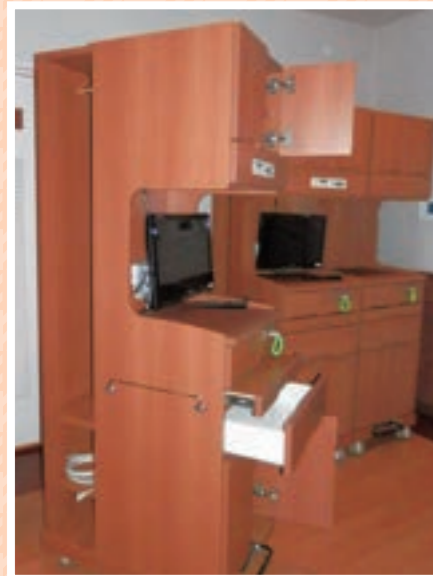
収納量が増え、鍵付きです

病院内の各部署で明るいニュースが入りました。病棟で床頭台、検査科で実験台がそれぞれ新調されました。薬局では処置薬の配置替えもあり新しくテーブルや棚が入り、使い勝手が良くなり仕事はかどりそうです。