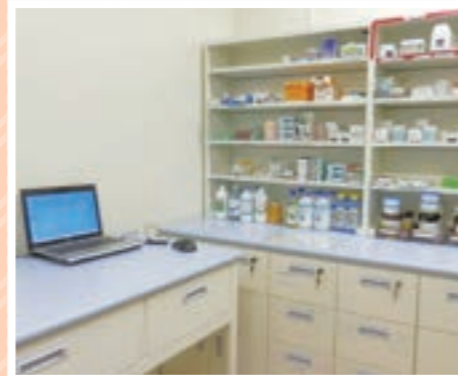
部屋が一層明るくなりました