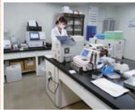
動きやすく作業効率UP

病院内の各部署で明るいニュースが入りました。病棟で床頭台、検査科で実験台がそれぞれ新調されました。薬局では処置薬の配置替えもあり新しくテーブルや棚が入り、使い勝手が良くなり仕事はかどりそうです。